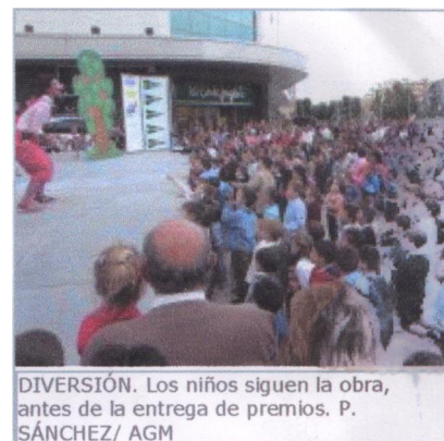
DIVERSIÓN. Los niños siguen la obra, antes de la entrega de premios.

La plaza de El Corte Inglés albergó ayer un festival infantil al que asistieron, entre niños y mayores, unas quinientas personas. Se representó la obra Los tres cerditos, dirigida por Pilar Culiáñez, y se entregaron los premios del concurso de dibujo del Día de la Madre y Don Quijote de la Mancha.